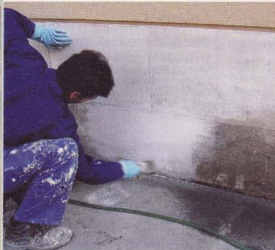
Ölige und fettige Verunreinigungen im Mauerwerk können mit Faxol BF100 Kompakt mühelos entfernt werden.

mitteln, und wird aus Pflanzenextrakten hergestellt. Es ist ungiftig (Wassergefährdungsklasse 0), besonders umweltverträglich und zu 100 Prozent biologisch abbaubar. Faxol BF100 Kompakt ist nicht feuergefährlich, nicht entzündbar und nicht explosiv und keiner kennzeichnungspflichtigen Zubereitung im Sinne des österreichischen Chemikaliengesetzes unterworfen. Faxol BF100 Kompakt ist lichtgeschützt mindestens ein Jahr haltbar. Kleinere Mengen Faxol BF100 Kompakt können, soweit mit lokalen Bestim-